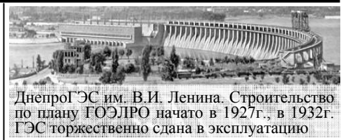
ДнепроГЭС им. В.И. Ленина. Строительство по плану ГОЭЛРО начато в 1927г., в 1932г. ГЭС торжественно сдана в эксплуатацию.

Исполком Съезда граждан СССР Оргкомитет Большевицкой платформы в КПСС Военно-народный Совет СССР Москва, 24 октября 2005 г